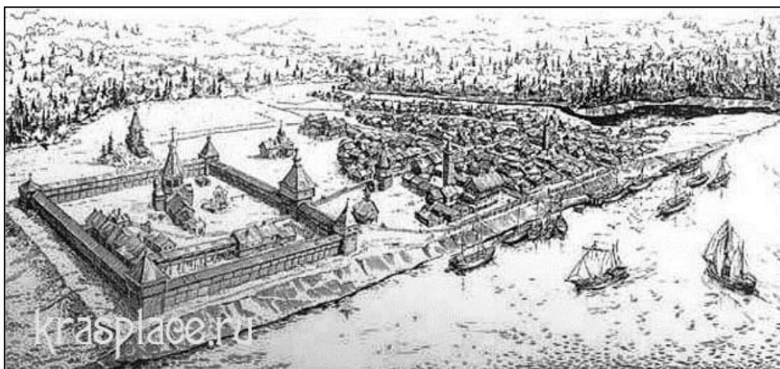
Рис. 1. Реконструкция сибирского города

ства сибирского города. Подпишите названия не менее пяти основных сооружений сибирского города.